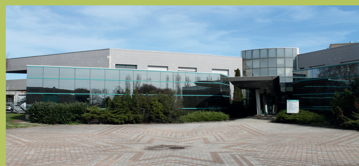
Site de Thouars