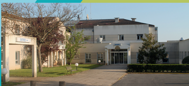
Site de Parthenay