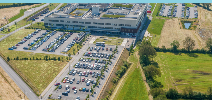
Site de Faye l'Abbesse